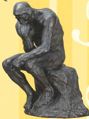
ロダン(考える人)(小型)