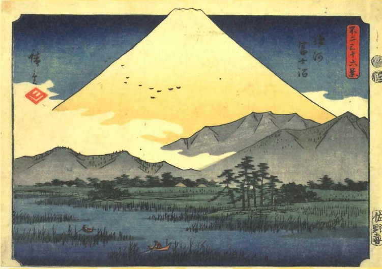
歌川広重(不二三十六景/駿河富士沼)